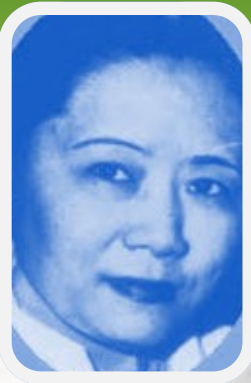
Chien Shiung Wu