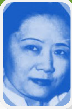
Chien Shiung Wu