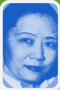
Chien Shiung Wu